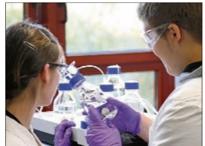
Beim Herbstpraktikum lernen Schüler die Arbeit in Unternehmen und wissenschaftlichen Instituten des Technologieparks kennen.